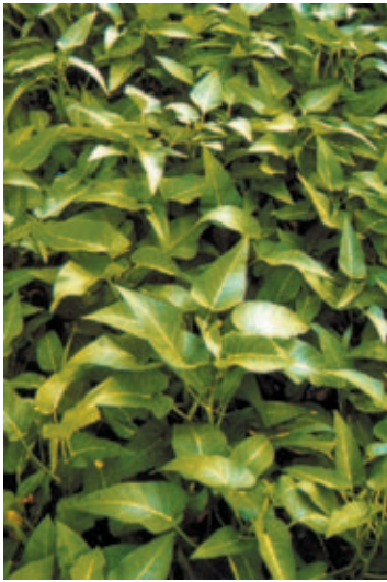
空 ク 心 心 菜 カ