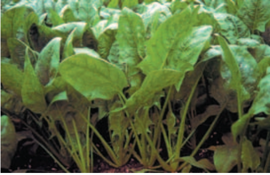
菠 ウ 菜 カ