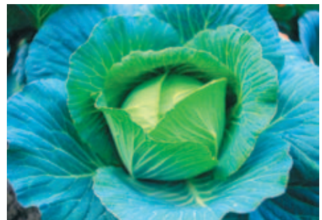
高 タカ 麗 カ 菜 カ

生 シ 字 ジ 二 ニ 蔬 ア 菜 カ 青 ク 江 江 空 ク 心 心 白 オ 高 タカ