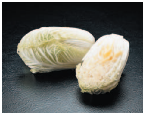
大 オ 白 白 菜 カ