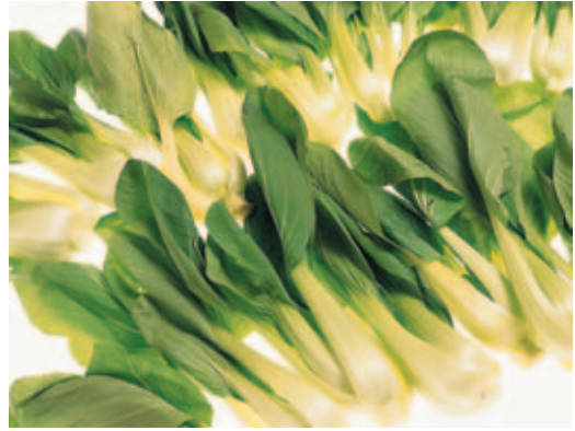
青 ク 江 江 菜 カ